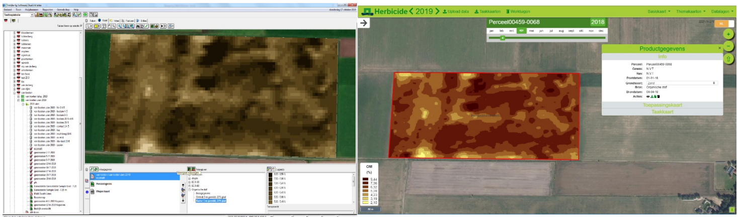
Figuur 1 Bodemkaart van organische stof in FarmWorks (links) en bodemkaart in Akkerweb (rechts)

Er is een bodemkaart gebruikt, welke gemaakt is met de Veris-MSP3 bodemscan. Omdat het hier gaat om een zanderig perceel is er gekozen om de variëren op basis van organische stof percentage. Deze teler heeft ervoor gekozen om alles zelf in FarmWorks te doen, maar wel aan de hand van de bestaande rekenregels. De bodemkaart van de organische stof, gemeten met de Veris-MSP3, is hieronder te zien. Een andere optie is om de organische stof kaart in te laden in Akkerweb applicatie voor variabel bodemherbicide om de berekeningen automatisch uit te laten voeren.