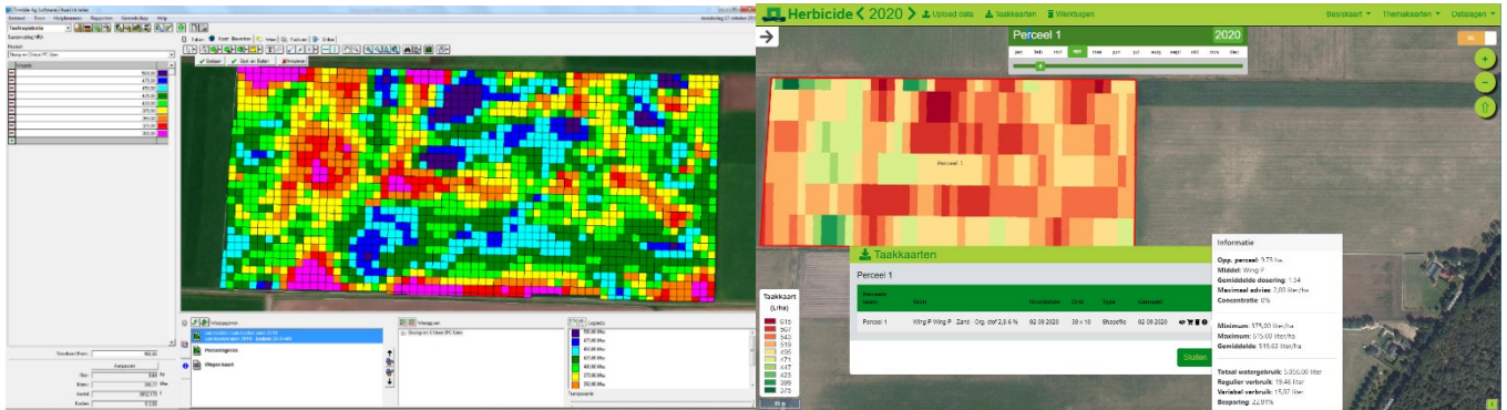
Figuur 3 Taakkaart in FarmWorks (links) en Taakkaart in Akkerweb (rechts)

Op basis van de doseerkaart is een taakkaart gemaakt die de doseerkaart aanpast aan de rijrichting en de afmetingen van de spuit. De taakkaart in Akkerweb is automatisch gegenereerd op basis van de wetenschappelijk onderbouwde rekenregels. De taakkaart in FarmWorks is met de hand gemaakt op basis van dezelfde rekenregels.