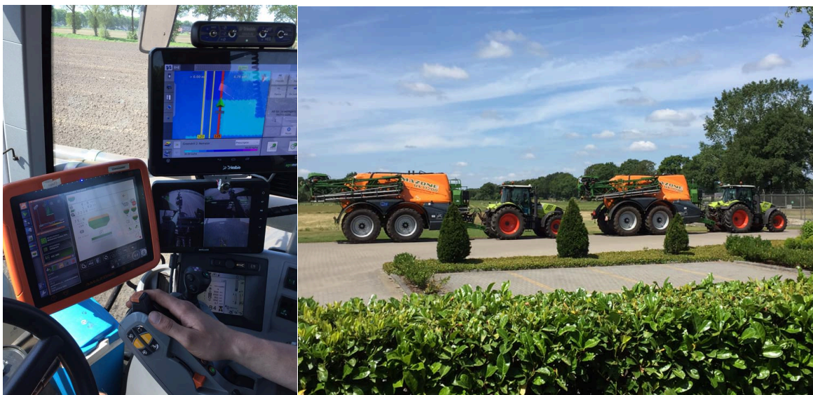
Figuur 4 Ingeladen taakkaart op de Amapad

Deze taakkaart geeft de variatie in de dosering weer. Variërend van 400 (0.94) l/ha tot 600 (1.97) l/ha spuitvloeistof (middel). Deze taakkaart is ingeladen in de Amapad zodat deze toegediend kan worden met de getrokken Amazone spuit (zie onderstaande foto's). Met deze spuit kan alleen over de volle breedte van de spuitboom gevarieerd worden.